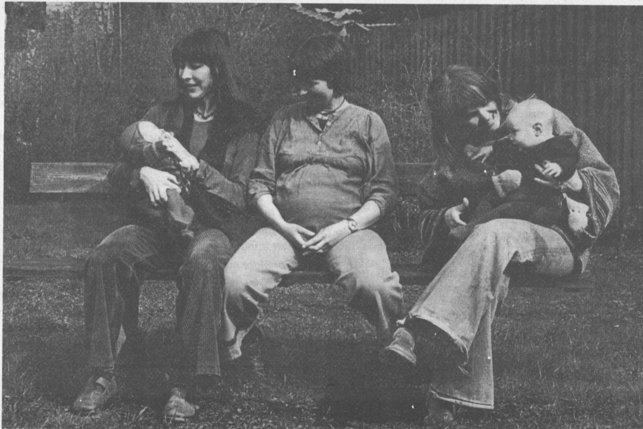
Lærlingelovens paragraffer 10, 22 stk 1: »Bliver en kvindelig lærling gravid uden at hæve lærforholdet i overensstemmelse med paragraf 22 stk 1j, kan hver af parterne forlange lærforholdet afbrudt i indtil 3 måneder før og 1 måned efter fødslen, således at lærforholdet forlænges tilsvarende, er det læremesteren, der forlanger lærforholdet afbrudt, og lærlingen modsætter sig dette, kan læremesteren hæve lærforholdet.»

Manglen på daginstitutioner er et alvorligt problem. For mange kvinder betyder det en ufrivillig forlængelse af barselsorloven ud i arbejdsløshed, - eller en eller anden mere eller mindre tilfældig pasning af barnet. Nedsænkningerne på daginstitutionsområdet er altså reelt med til at presse kvinderne ud af arbejdsmarkedet. Derfor bliver den udvidede barselsorlov kun et ringe fremskridt, hvis den ikke følges op af krav om fuld institutionsdækning.