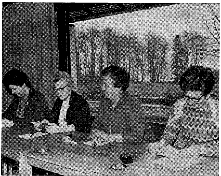
Da hovedbestyrelse og forretningsudvalg arbejdede med forberedelse af kongres og delegeretmøde under et møde på Kursus-egendommen Højstrupgård ved Helsingør. Det er her, fagbevægelsen netop nu er ved at færdiggøre den nye højskole, der får navnet LO-skolen.

Vil kvinderne for alvor høres i den offentlige debat, må vi sørge for at udøve vores stemmeret, når vi har den. Og vi vil jo ikke afgive den.