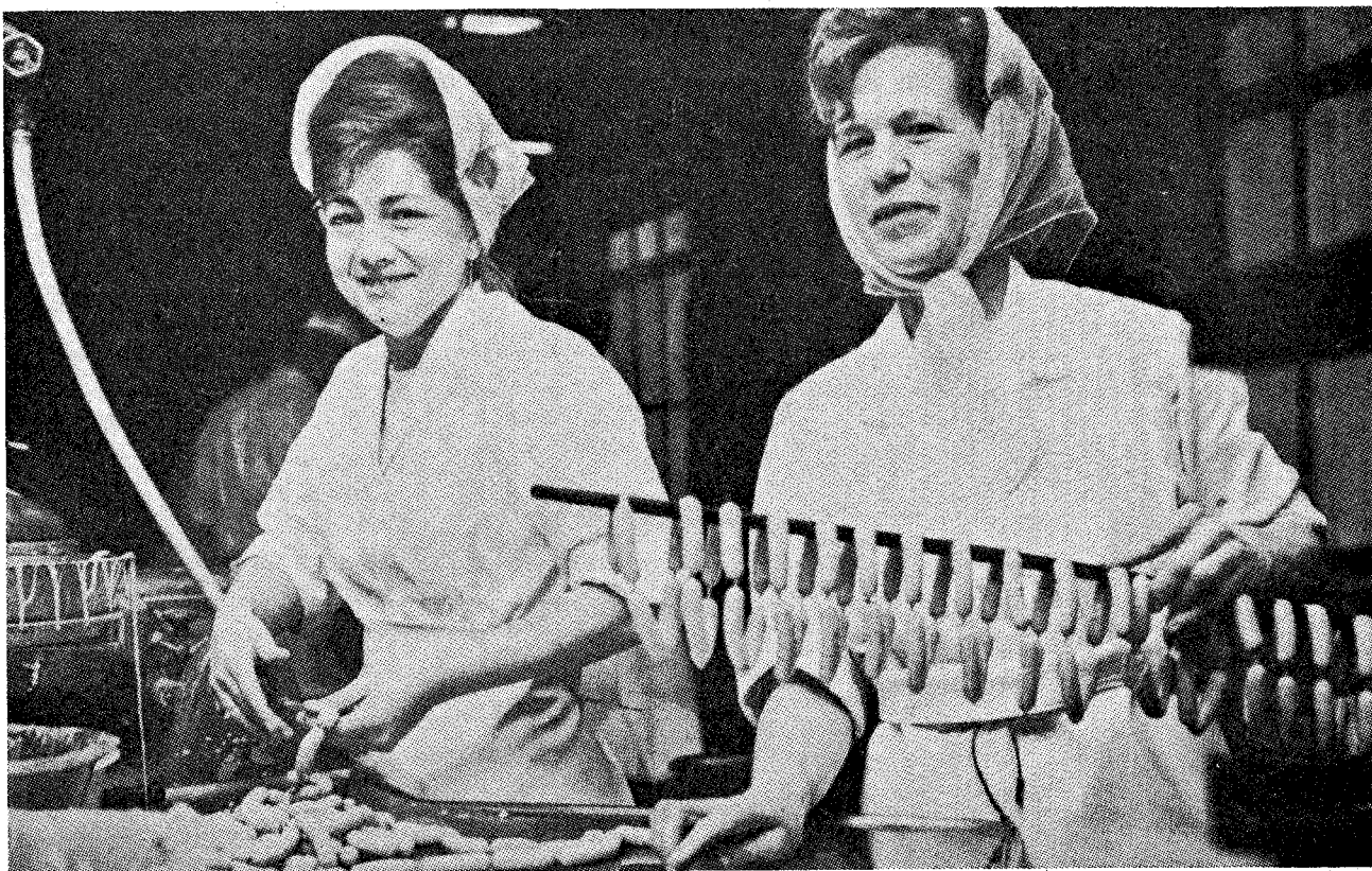
Af Slagteriarbejderforbundets 19.000 medlemmer er en fjerdedel kvinder.