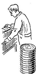
Litograf- medhjæl- pere 1401 øre