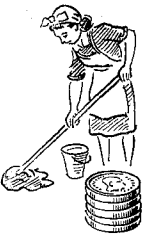
Rengørings- arbejdere 805 øre