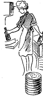
Bryggeri- arbejdere 1103 øre