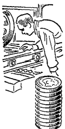
Trykkeri- arbejdere 1453 øre