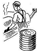
Farveri- arbejdere 1018 øre

Gennemsnitlig timefortjeneste incl. alle tillæg, bl. a. søgnehelldagstillæg, overtidstillæg og feriepenge i Hovedstaden 3. kvartal 1966.