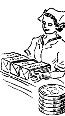
Bageri- og biscuitarb. 745 øre