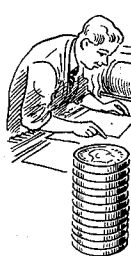
Litografer 1560 øre