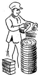
Murere 1716 øre

Gennemsnitlig timefortjeneste incl. alle tillæg, bl. a. søgnehelldagsarbejde, overtidstillæg og feriepenge i Hovedstaden 3. kvartal 1966.