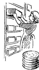
Lager- arbejdere 826 øre