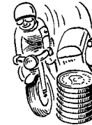
Bude 910 øre