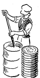
Murer- arbejds- mænd 1559 øre