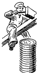
Tømrere 1714 øre