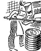
Bageri- og biscuitarb. 941 øre