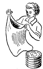
Sække- arbejdere 827 øre