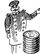
Biograf- personale 881 øre