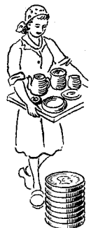
Keramisk industri 1070 øre