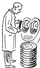
Lædervare- og rejsetojsarb. 1201 øre