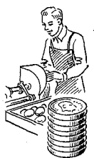
Børstenbin- dere 1072 øre