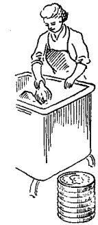
Slakteri- arbejdere 1138 øre