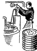
Farve- og Jak- fabrikarb. 1130 øre