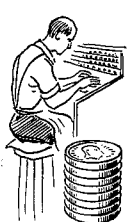
Cigar- arbejdere 1002 øre