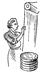
Farveri- arbejdere 763 øre