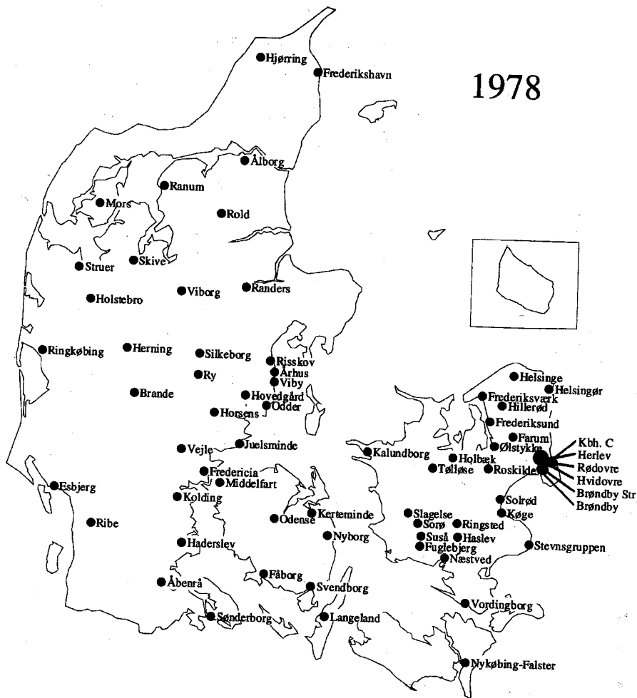
Figur 5.1. Rødstrømper og kvindegrupper i Danmark 1978 13

Note: Denne liste over kvindegrupper i Danmark i 1978 må anses for en minimumsliste, idet mange grupper sikkert ikke har ladet sig registrere nogen steder. Ingen af de nye krisecentre var startet i 1978, se kortet over 1983, side 347.