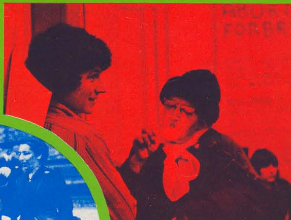
I stedet blev der om aftenen holdt åbent hus i det nye Kvindehus, hvor repræsentanter fra forskellige kvindeorganisationer og -grupper fortalte om deres arbejde og planlagte aktiviteter. Desuden var der sang, teater og musik.