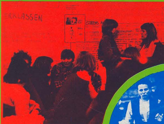
I modsætning til tidligere år deltog rødstrømperne ikke i demonstrationen på den Internationale Kvindedag den 8. marts.

På den anden internationale socialistiske kvindekongres, som blev holdt i København i 1910, blev den internationale kvindedag indstiftet på forslag fra bl.a. Clara Zetkin.