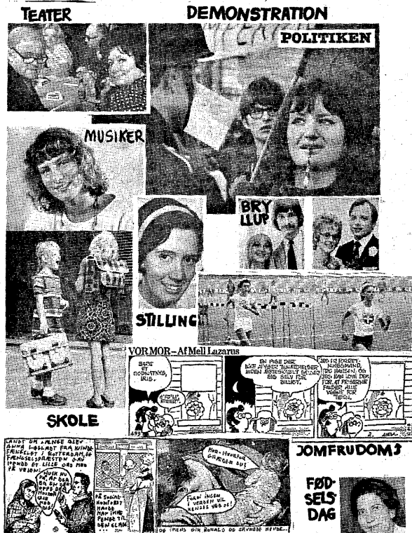
Politiken, onsdag d. 2. august: kvinder med ben i næsen og masser af overskud.