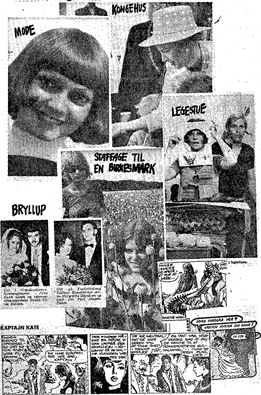
Berlingske Tidende, onsdag d. 2. august: Kinder, Kirche und Küche