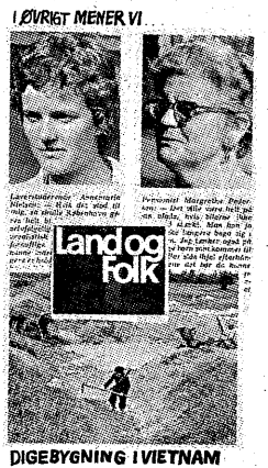
Land og Folk, onsdag d. 2. august: kvinder i dag-ligdagen.