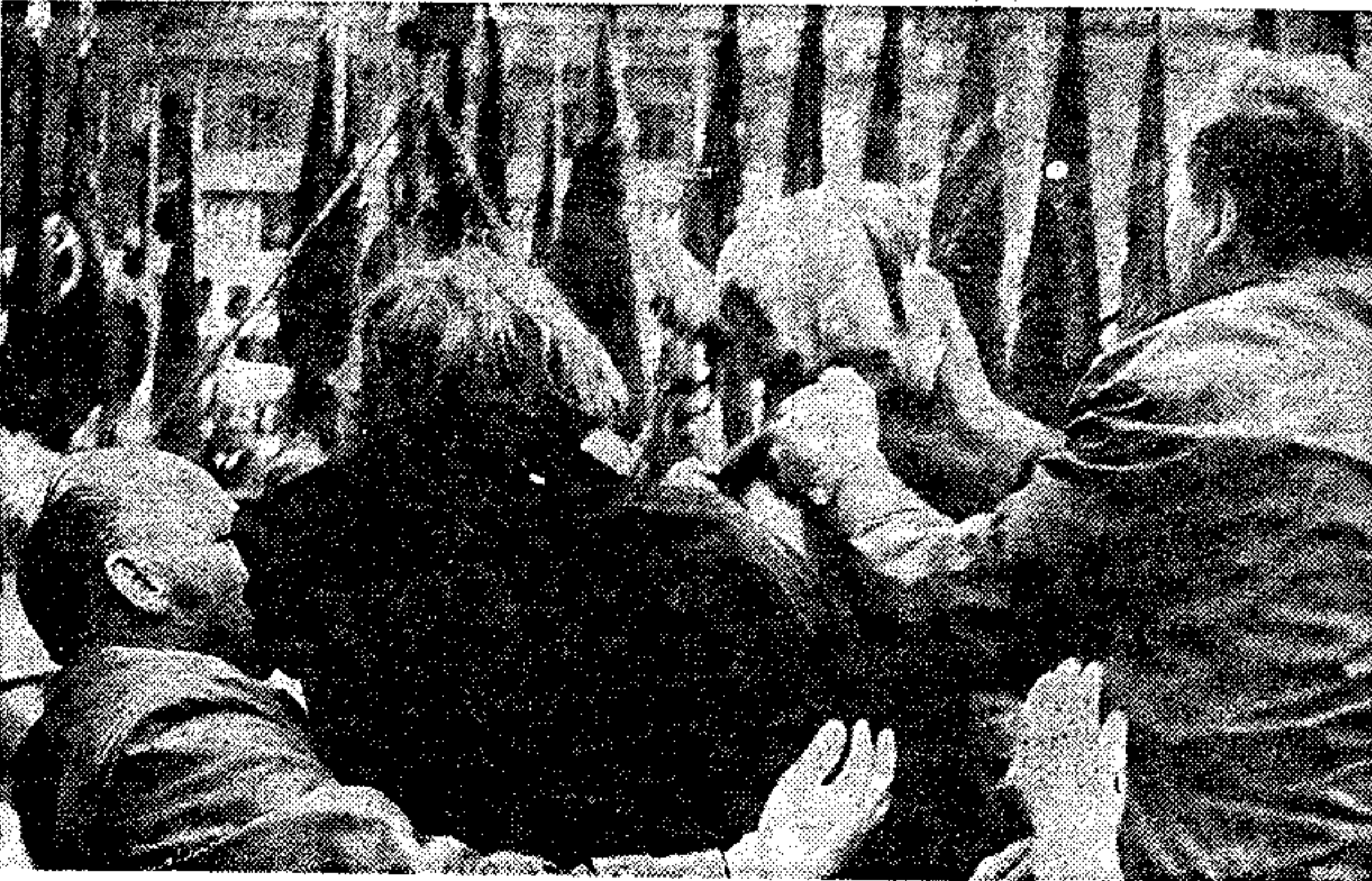
Ud med de ubehagelige demonstranter...