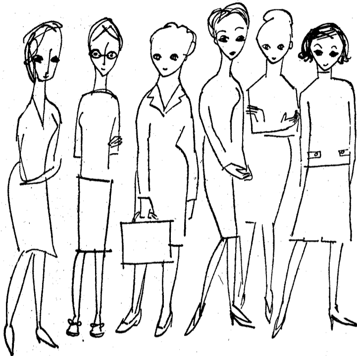
De overkvalificerede. — Tegning af Ulla Kampmann

S E, giftes vil vi jo allesammen og have børn, og det faar langt de fleste af os ogsaa. I vor begejstring over ligestillingen er det vel nok et grundlæggende udgangspunkt, vi har været lidt for tilbøjelige til at overse. Og det hæver sig at overse grundlæggende ting. Kan De ikke se ur-moderen, det urkvindelige, eller hvad man nu vil, staa bag alle de skolede, højt uddannede, overkvalificerede kvinder og gni de sig i hænderne: Naa, saa — I mener, I er overkvalificerede — næ, piger,